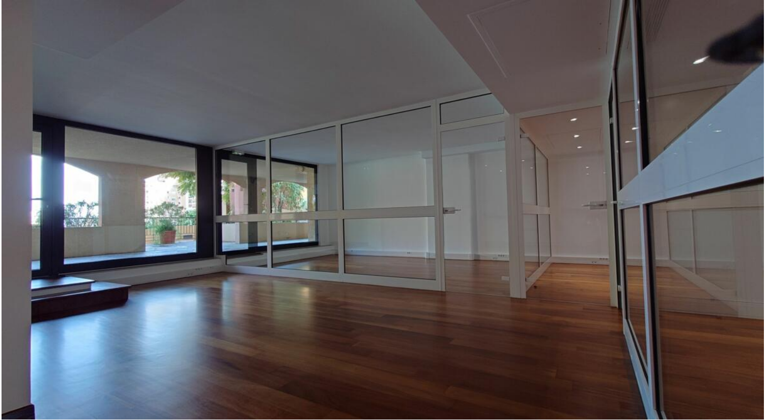
Résidence « Le Raphael » Bureaux n° 725-7520