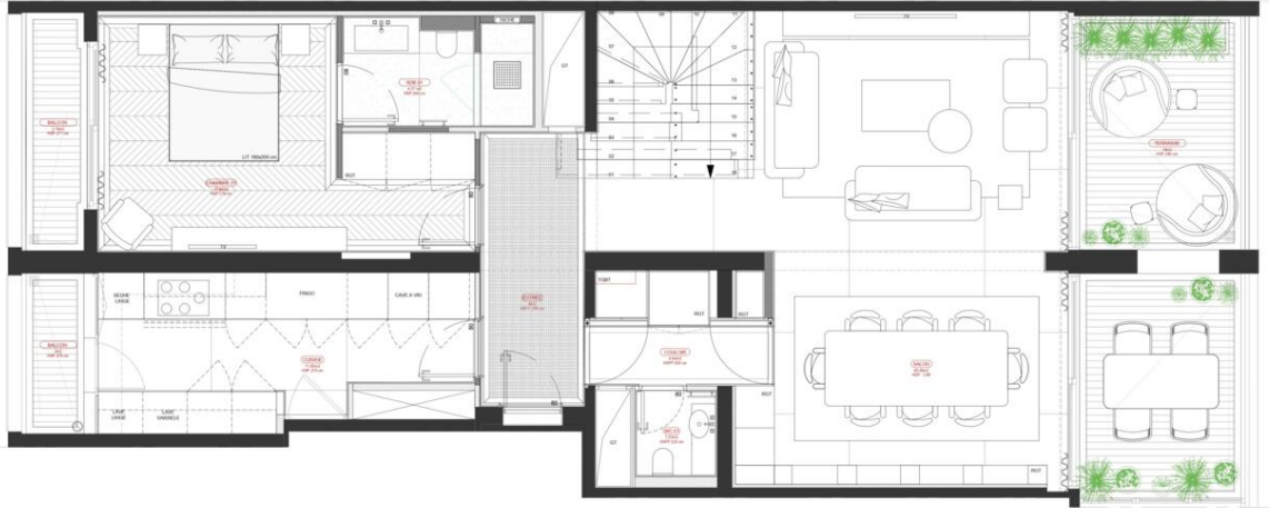
1 PLAN PROJET RDC SCALE 1:50