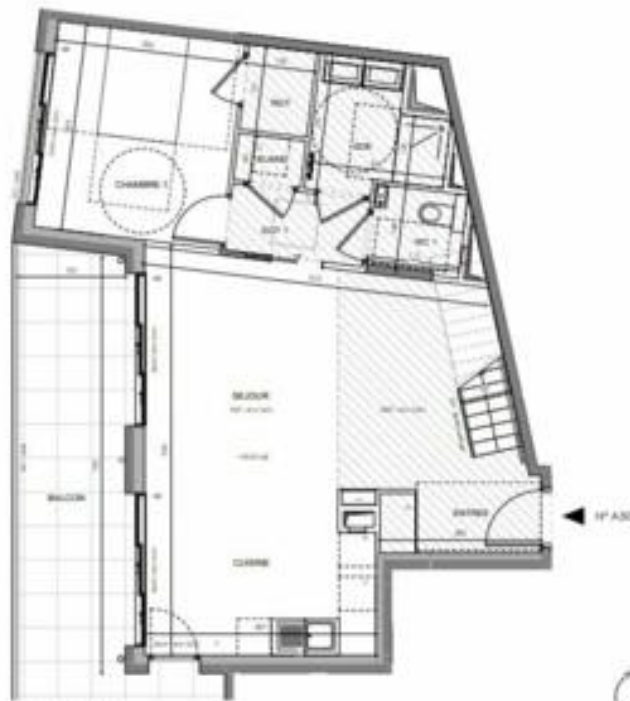
NIVEAU BAS DUPLEX