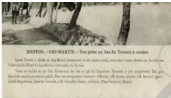
Avant de la vente de terrains au cap Martin sur une carte postale de l'époque.