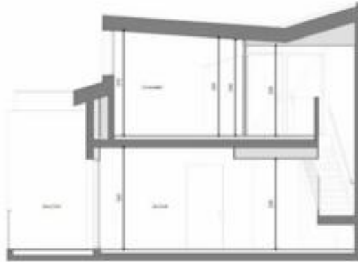
COUPE DE FINANCE

HALL A APPARTEMENT DE 3 PIECES DUPLEX d' 4307 au 3ème étage