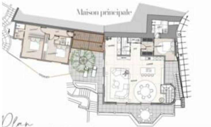
Plan du rez de chaussée