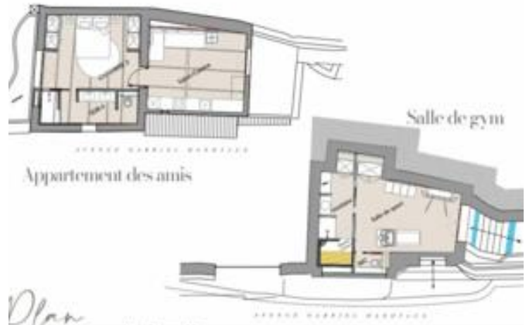
Plan du rez de jardin