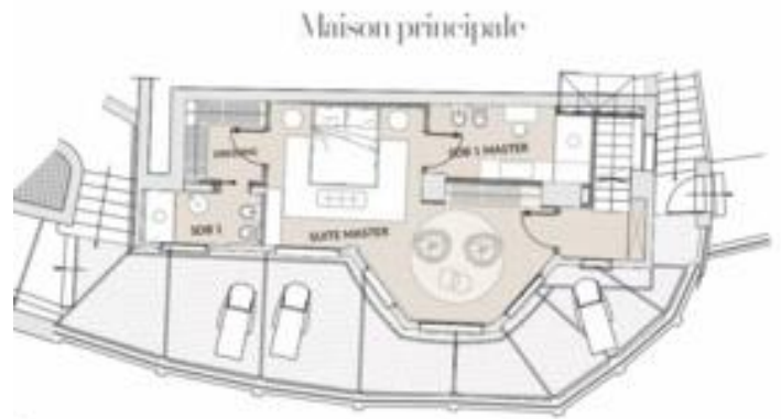
Plan du rez de jardin